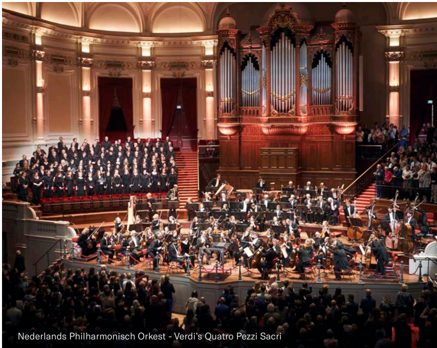
Nederlands Philharmonisch Orkest - Verdi's Quatro Pezzi Sacri