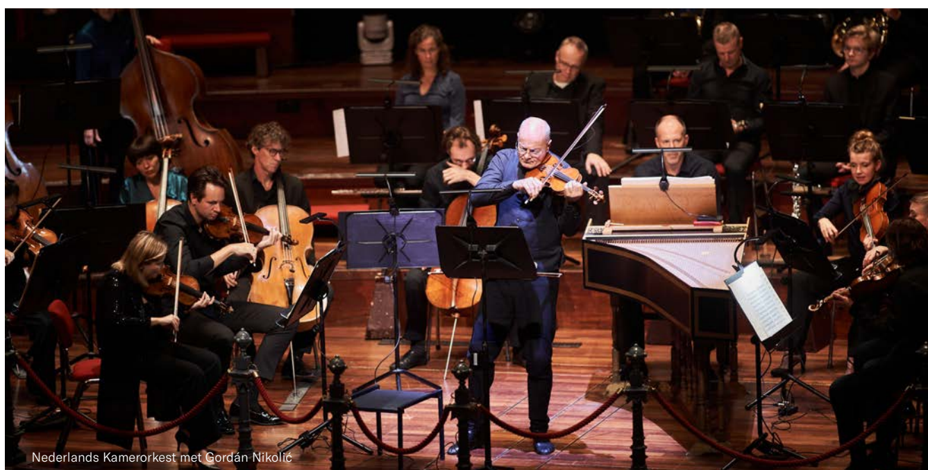
Nederlands Kamerorkest met Gordán Nikolic