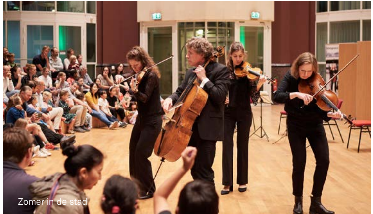
Zomer in de stad

In juli vond voor de eerste keer ons Koepelfestival plaats. Twee dagen werd er muziek gemaakt voor en door de buurt. Musici van onze orkesten speelden met amateurmusici samen. Op de zaterdag was er een concertprogramma speciaal voor kinderen, waar ook het Leerorkest een concert gaf. Op de zondag waren er zes verschillende concerten, verdeeld over twee blokken. Amateurmusici uit Amsterdam Oost kregen zo de kans om op te treden in de NedPhO-Koepel. Ook speelde een ensemble van het Amsterdams Andalusisch Orkest.