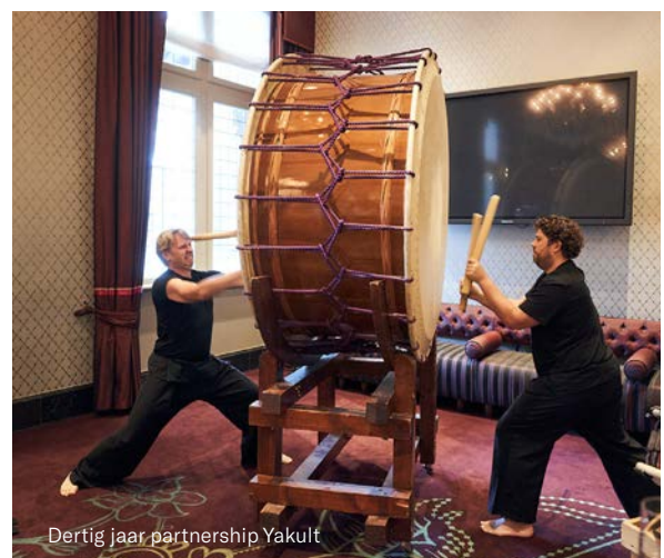
Dertig jaar partnership Yakult

In 2023 vonden enkele bijzondere sponsorevents plaats. Van Uden Holding in Rotterdam, al ruim tien jaar sponsor van ons orkest, vierde het 175-jarig bestaan met een feest in Theater Walhalla, waar het Nederlands Kamerorkest onder leiding van Gordan Nikolić de Holberg Suite van Grieg uitvoerde. Van Uden is in de zomer van 2023 dedicated partner van de orkestacademie geworden, voor een periode van drie jaar. Mede dankzij deze bijdrage hebben we in het najaar van 2023 een coördinator orkestacademie kunnen aanstellen. Ook hadden we een bijzonder jubileum met onze hoofdsponsor Yakult en vierden we op 18 september dertig jaar partnership, met een feestelijke avond in Het Concertgebouw. Het contract met hoofdsponsor Yakult is verlengd, met de intentie voor nog twee jaar, tot en met 2026 en in gezamenlijkheid worden er plannen voor de toekomst ontwikkeld.