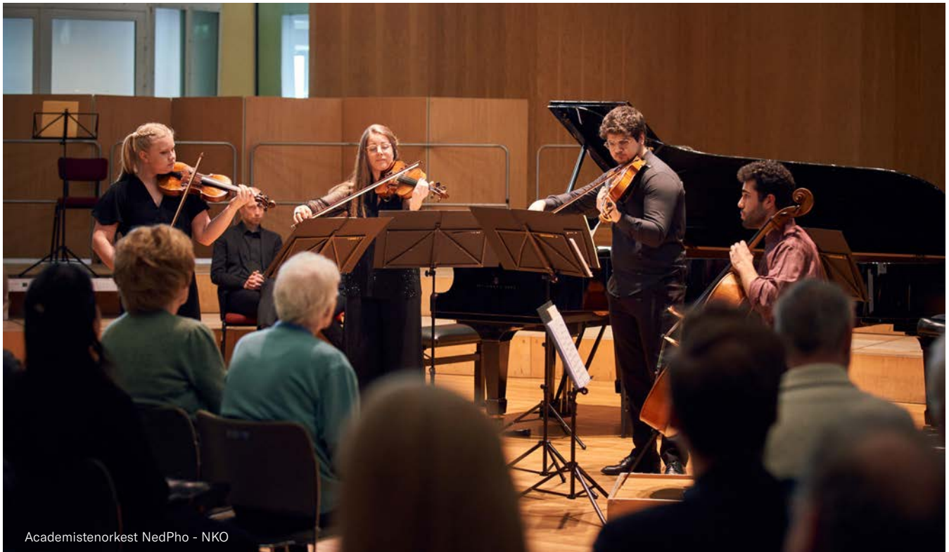
Academistenorkest NedPho - NKO

Onze Orkestacademie hebben we hervormd: sinds 2021 is die ook voor recent afgestudeerde musici toegankelijk in plaats van alleen voor studenten en we nodigen musici uit het hele land uit te solliciteren in plaats van alleen musici uit Amsterdam. Ten behoeve van eerlijke beloning hebben we de honoraria voor academisten verhoogd. Doordat de academisten vaak al zijn afgestudeerd, kunnen ze ook plaats nemen in het orkest; zij spelen nu minimaal tien weken mee met een van onze orkesten. Afgelopen jaar is er weer een volledig academiejaar geweest. De academisten van seizoen '22-'23 hebben hun academiejaar bij ons succesvol afgesloten voor de zomer. Daarna zijn er zes nieuwe academisten begonnen. In 2023 is er ook een Coördinator Orkestacademie aangenomen om de academisten beter te begeleiden. Wij gaan in de komende jaren de academie uitbreiden met meer aandacht voor persoonlijke ontwikkeling, gerichte coaching en het aanbieden van uitgebreidere workshops en masterclasses.