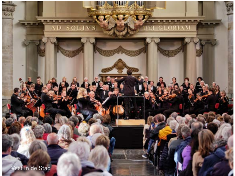
Vest in de Stad

In oktober heeft het Nederlands Kamerorkest een concert gegeven samen met lokale amateurmusici op het festival Vest in de Stad in Alkmaar. Als huisorkest van de stad werden er twee concerten gespeeld in de Grote Kerk. Het Kamerorkest kon zich zo presenteren aan een groot publiek. 25 amateurmusici speelden mee in het Kamerorkest. Hiervoor hebben wij veel contact gehad met lokale muziekverenigingen en orkesten.